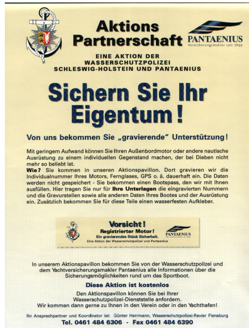
Das fertige Infoplatkat für den Einsatz in Schleswig-Holstein