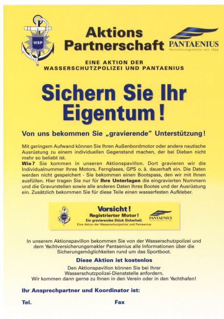
Das überarbeitete - jetzt neutrale - Plakat für alle Wasserschutzpolizeien

Der Ansprechpartner kann individuell eingedruckt werden.